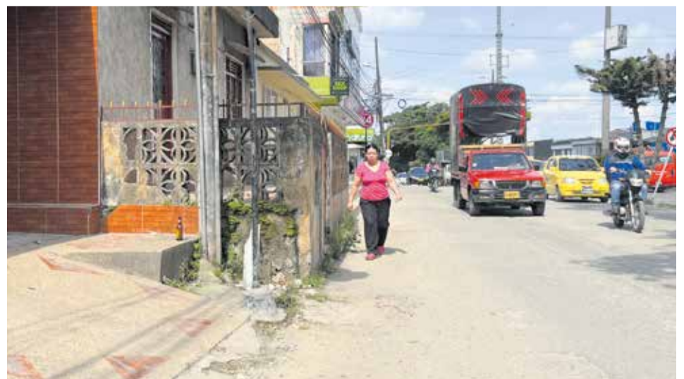
Avenida Ambalá, barrio Gaviota.