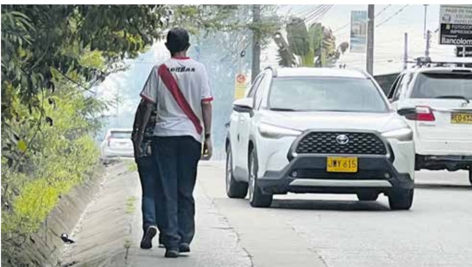
Sector de Calambeo.

“Hay una cosa que se llama la pirámide de la movilidad, la cual es una forma de mostrar cuál es el modelo de movilidad sostenible y, por lo tanto, hacia dónde se deben dirigir los recursos de inversión. En esto es claro que se debe priorizar el peatón, luego el ciclista y el transporte colectivo hasta llegar, por último, a los vehículos”, explicó.