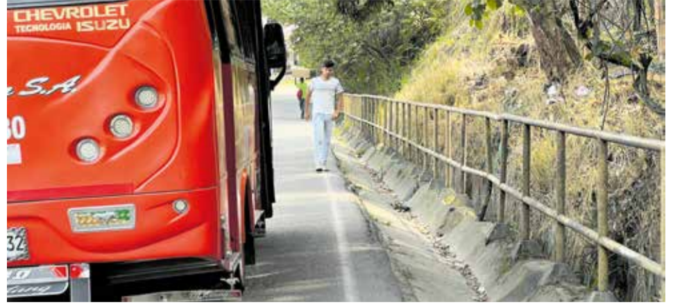
Carrera Quinta entre calles 50 y 60.

Varios expertos advierten que la falta de andenes ha incidido en los índices de accidentalidad con peatones.