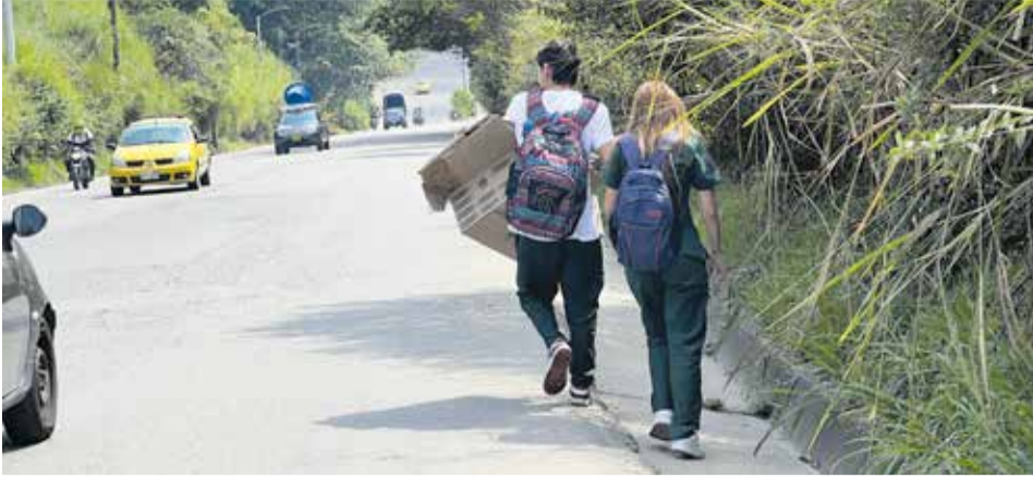
Carrera Quinta entre Santa Ana y el Topacio.